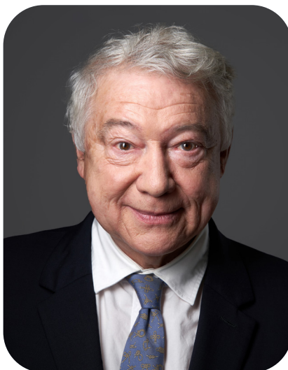
Directeur général délégué