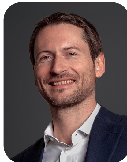
Directeur général délégué